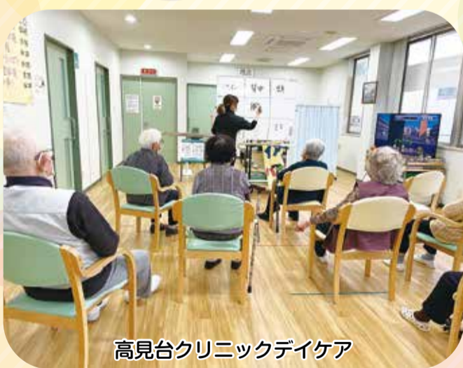
高見台クリニックデイケア