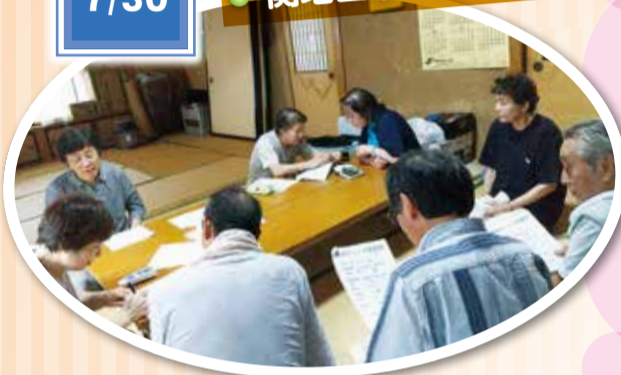
地域配布者の方から自治会長につないでもらい、初めての班会を開くことが出来た。口の動きチェックなどの健康チェックを行った。