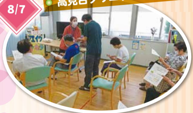
栄養科職員による「食べて病気に強くなる」というテーマで講話を行った。脳年齢チェックなどの健康チェックも行った。