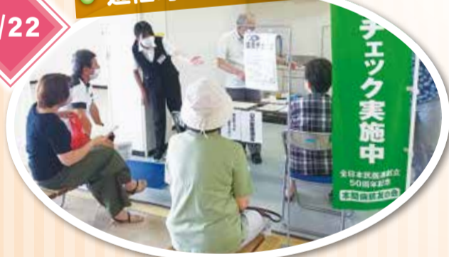
「遊佐ショッピングセンターエルパ」内での健康チェックを初めて行い、広報を見た方や買い物途中の方々が参加してくれた。