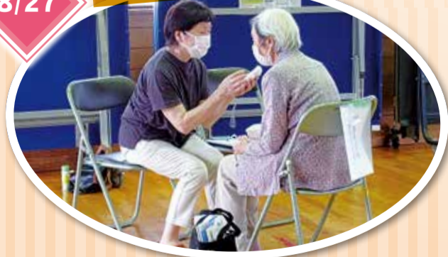
大変暑い中、会場に足を運んでくれた方々と雑談も交えながら健康チェックを行うことができた。