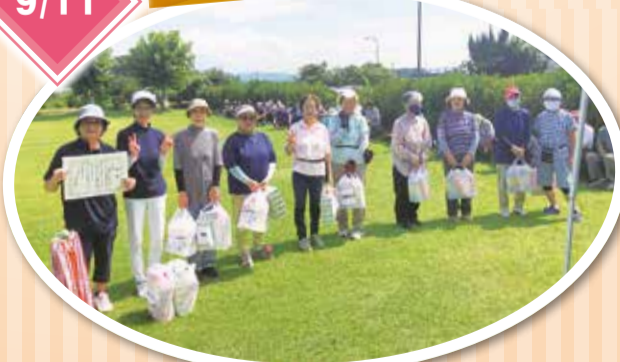
曇り空から日が差したかと思ったら急に強い雨が降ったりと天気もグラウンド状況も変わる中、計86人の参加者が精一杯プレーしました。