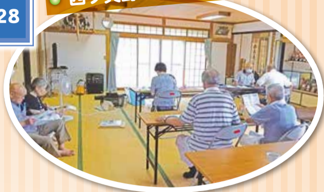
老人クラブの集まりに参加して健康チェックを行った。和やかな雰囲気で行進し、「来年も来てください」との声をかけてもらった。